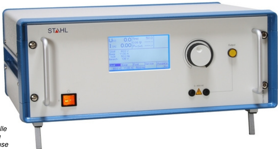
Elektronisch geregelt Wechsel- Spannungsquelle GV-100.32B im Einschubgehäuse