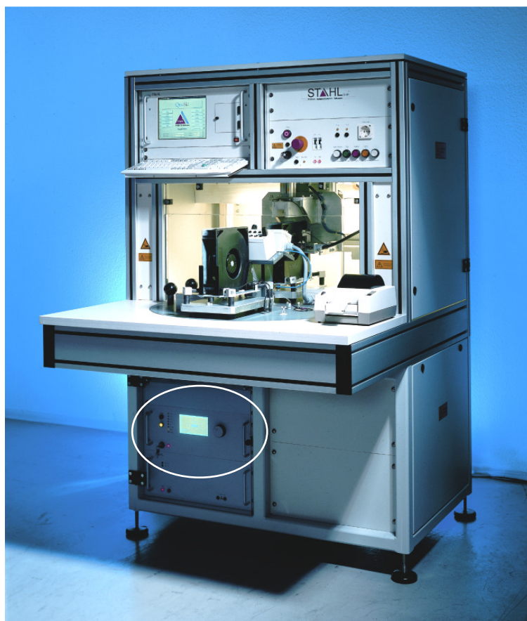
Ein Beispiel aus der Praxis: AC-Quelle integriert in eine PC-gesteuerte Drehtischprüfanlage.